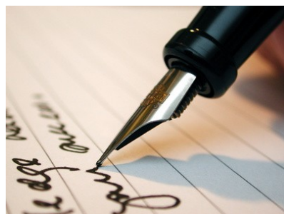
CV et lettre de motivation

Ils sont destinés aux membres des jurys d'admission et constituent de ce fait les seuls documents qui sont mis à leur disposition. En effet, le jury d'admission n'a pas connaissance du dossier du candidat qui a été examiné par le jury d'admissibilité.